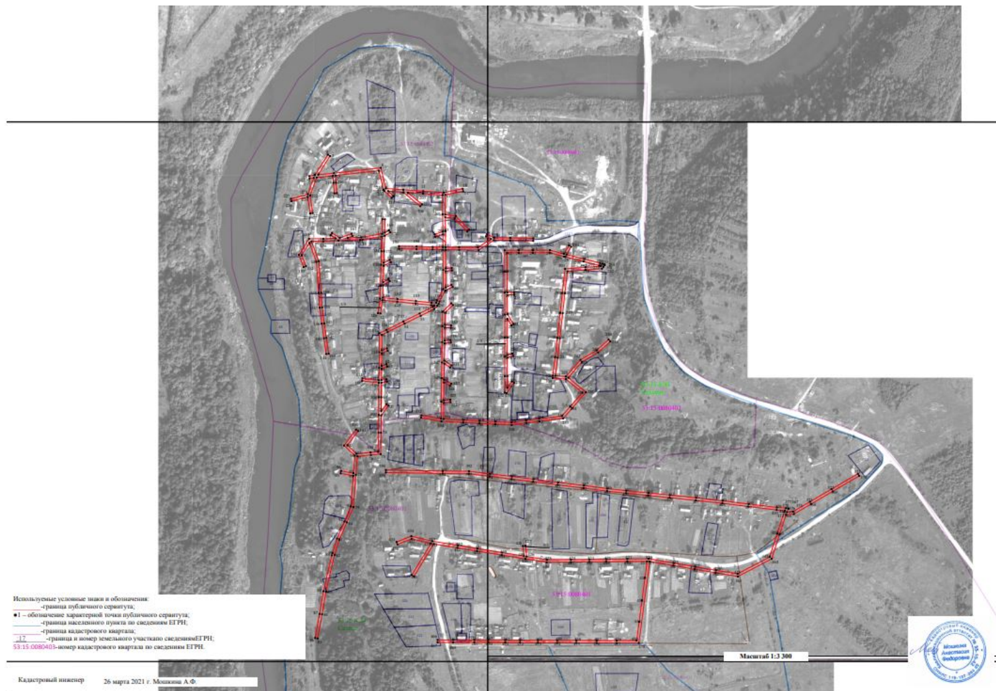
Схема границ размещения публичного сервитута Объект «ВЛ-0.4 кВ нп Селеево»